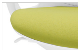
Regulação da altura por elevação a gás.