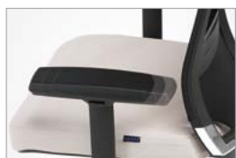
Braço regulável em profundidade (em 50mm)