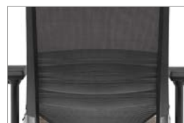
Apoio lombar regulável (em 80mm)

A linha Orpheus revela-se como uma cadeira operativa com um desenho moderno e elegante. Tem uma relação preço-qualidade ímpar e apresenta características invulgares no seu segmento, como por exemplo possuir um assento fabricado em espuma moldada para maior durabilidade e conforto. A opção de poder ser equipada com braços bastante ajustáveis que incluem regulação em altura, profundidade e orientação também é outro factor bastante atractivo.