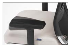
Braço regulável em orientação (+45°, 0°, -45°)