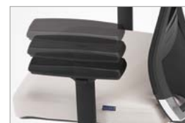
Braço regulável em altura (em 80mm)